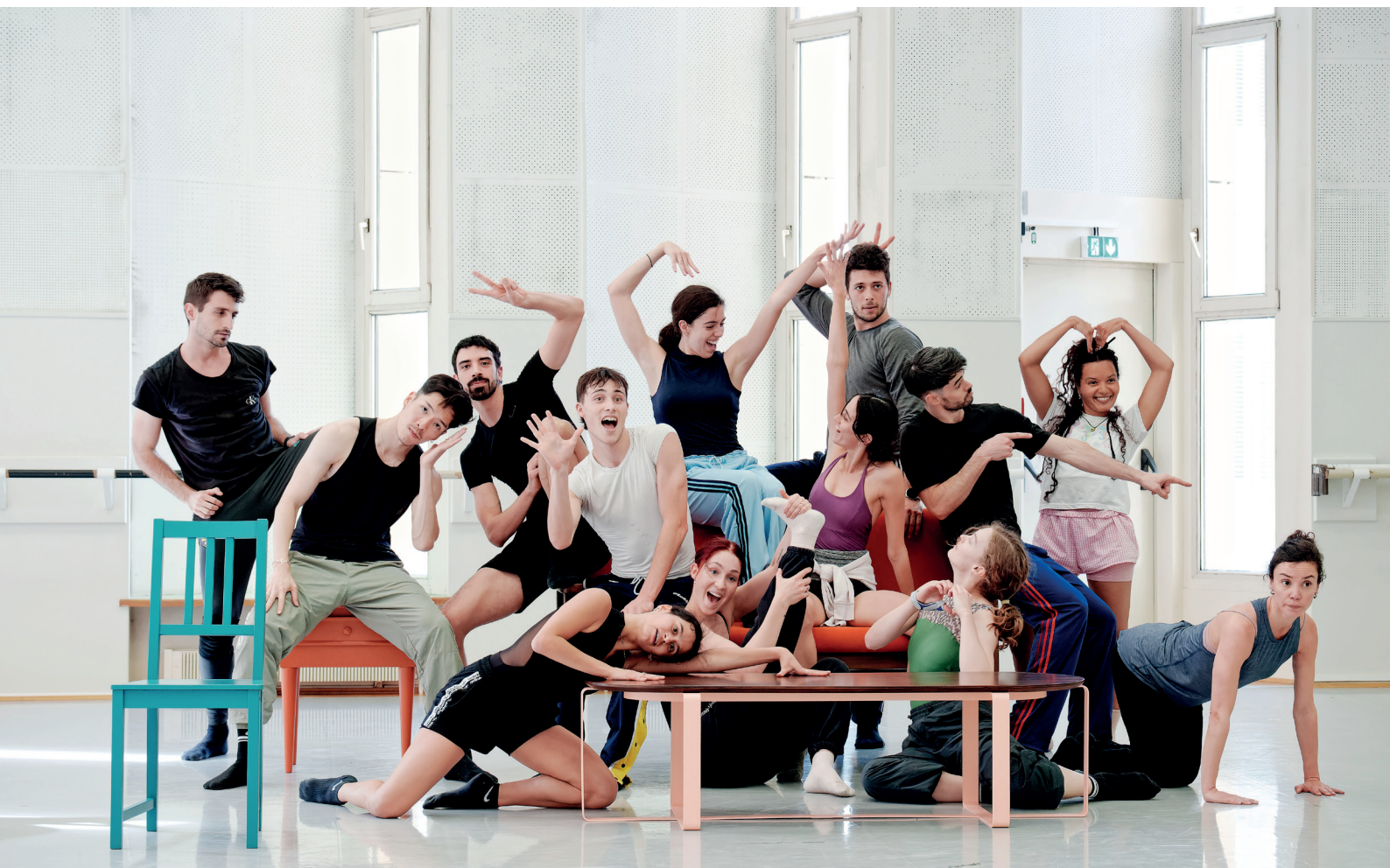
Sous les jupes, photo de répétition