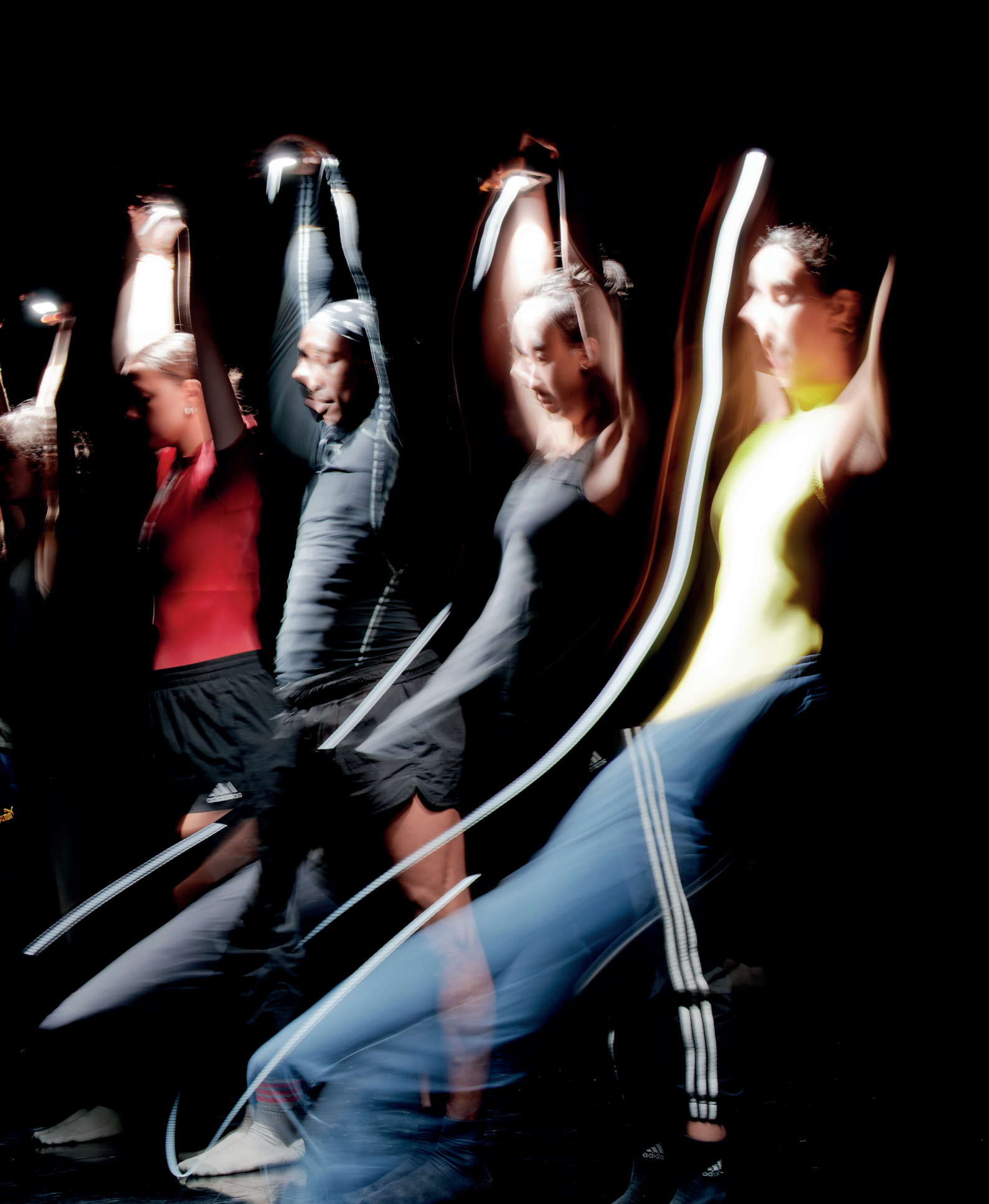
Rex, photo de répétition