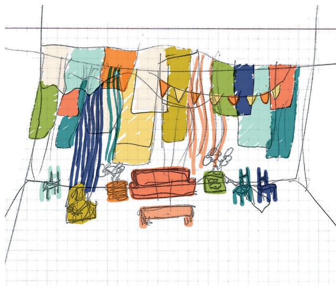
Croquis de la scénographie © Lemieux-Venne