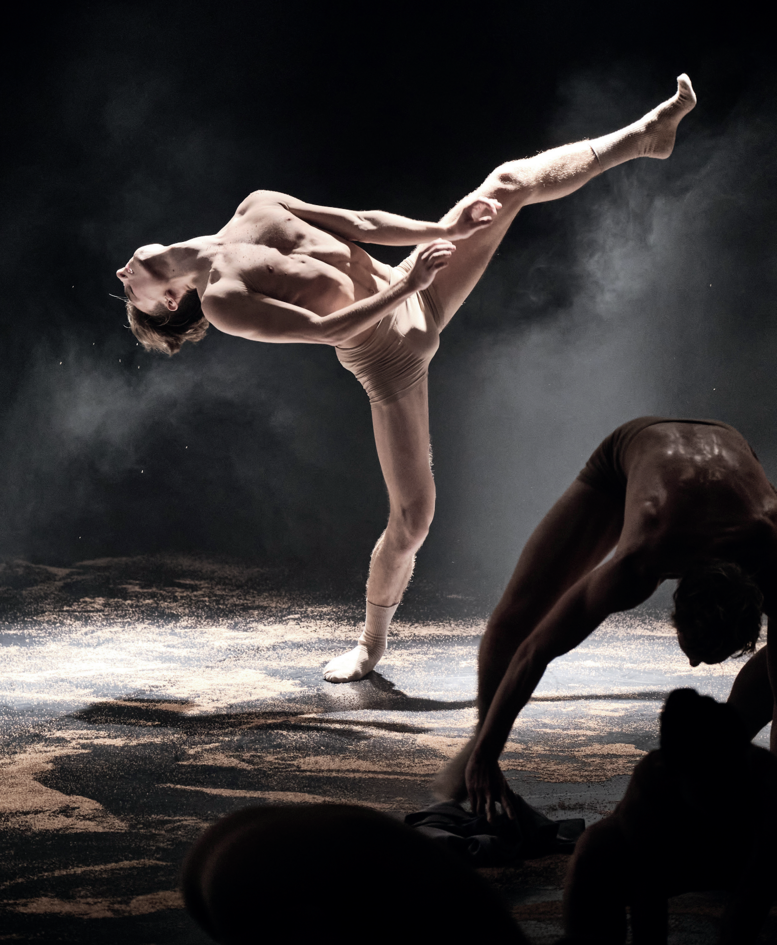
Poussière de Terre , photo du spectacle (2020)